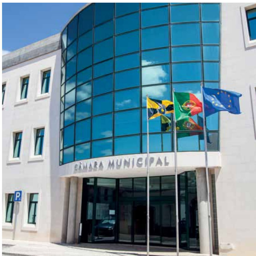
figura também numa interessante 9ª posição do grupo dos municípios portugueses de média dimensão (entre 20 mil e 100 mil habitantes). Quando ava-

Se Lagoa surge em 2018 como o primeiro dos 16 concelhos do Algarve,